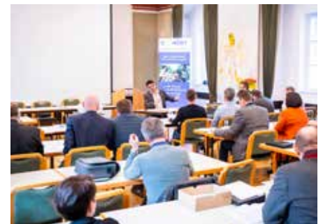
Blasmusiktradition in Niederösterreich zu fördern und zu stärken.

Der NÖBV blickt auf einen erfolgreichen Delegiertentag zurück und freut sich auf die weitere Zusammenarbeit mit den Mitgliedsvereinen. Der Verband wird weiterhin hart daran arbeiten, die