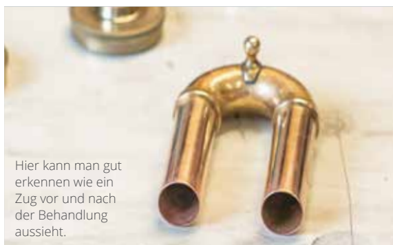
Hier kann man gut erkennen wie ein Zug vor und nach der Behandlung aussieht.