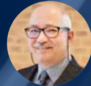
von Manfred Sternberger

Um trotzdem, oder gerade deshalb, unseren Musikvereinen eine Perspektive zu eröffnen, haben sich die Landeskapellmeister in Absprache mit den Bezirkskapellmeistern entschlossen, für 2021 eine Polka-Walzer-Marschbewertung anzubieten.