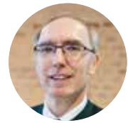
von Dr. Friedrich Anzenberger