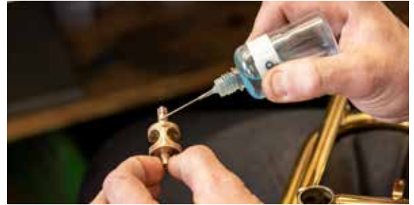
Es gibt viele Handgriffe, die man auch zu Hause erledigen kann und die dem Instrument gut tun.

• Einmal im Monat sollte die Oberfläche extra gepflegt werden: Lackierte Instrumente mit einem Lackpflegemittel (z.B. LaTromba Laquer Polish) behandeln, vergoldete und versilberte Instrumente können mit einem verdünnten Glasreiniger in Kombination mit einem sauberen Microfasertuch gereinigt werden. Bei starker Verschmutzung kann man sie mit Gold- oder Silberpolitur reinigen.