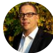
von Georg Speiser

Angelehnt an ein bekanntes Zitat „Stillstand heißt Rückschritt“ möchten wir auch weiter unseren Ansprüchen im Bereich der Stabführerausbildung gerecht werden und uns qualitativ verbessern.